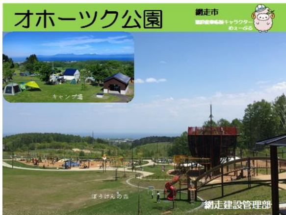
オホーツク公園(裏)