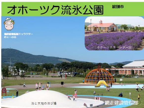
オホーツク流水公園(裏)